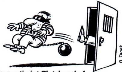
Amnestie ist Platzbeschaffung für neue Missetäter.

„Frau Kirchberger ist zum dritten Mal Witwe geworden“, berichtet die Nachbarin. – „Ach, woran starb denn der erste Mann?“ – „An Pilzvergiftung.“ – „Und der zweite?“ – „Ebenfalls an Pilzvergiftung.“ – „Und der dritte? Sie wollen doch nicht sagen, dass der auch ...“ – „Nein. Der hatte einen Schädelbruch. Er weigerte sich, die Pilze zu essen.“