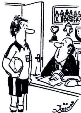
„Tut mir leid, dass wir dich verkaufen müssen – aber der Verein braucht einen neuen Rasenmäher!“

* „Herr Senfleben, Ihre Krankheit ist sehr verzwick“, meint der Chefarzt, „aber meine Operation wird die Medizin bereichern!“ – „Das glaube ich weniger, ich bin nämlich bloß in der Gebietskrankenkasse!“